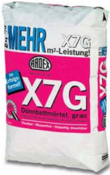
X7G – Başarı formülü İnce Tabaka Harcı