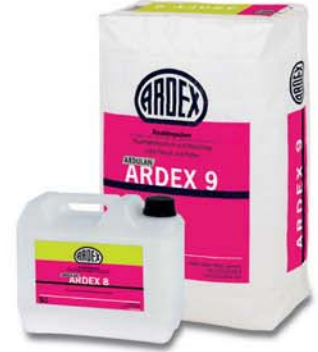
ARDEX 8+9 İki bileşenli Yalıtım Malzemesi