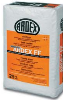
ARDEX FF Akıcı Derz Dolgusu