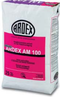
ARDEX AM 100 Duvar Tesviye Harcı