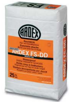
ARDEX FS-DD İnce-ve Dar Derz Dolgu Macunu