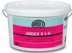
ARDEX S 1-K Yalıtım Malzemesi