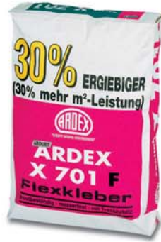
ARDEX X 701 F Elastikli Yapıştırıcı